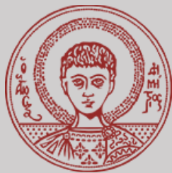
Universidad Aristóteles de Tesalónica